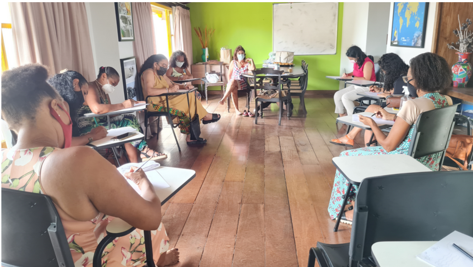
Encontro com os pais - dinâmicas e atividades.