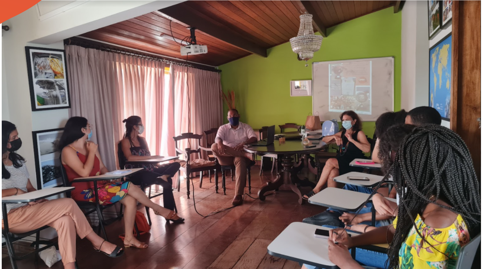
Culminância Projeto Cores Seminário de Comemoração da Declaração Universal dos Direitos Humanos Alunos do Ensino Médio