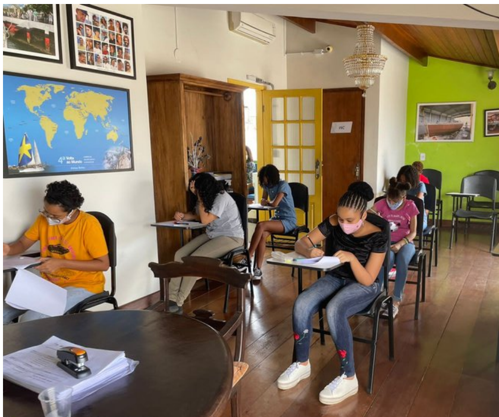
1ª etapa da seleção Cores 2021

Neste mês a prefeitura de Salvador começou a flexibilizar as atividades e demos início à tão sonhada seleção, ainda que de forma híbrida.