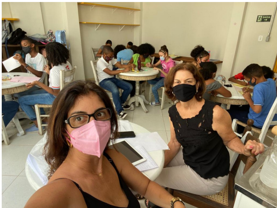
Dinâmica com alunos pré-selecionados Seleção 2021